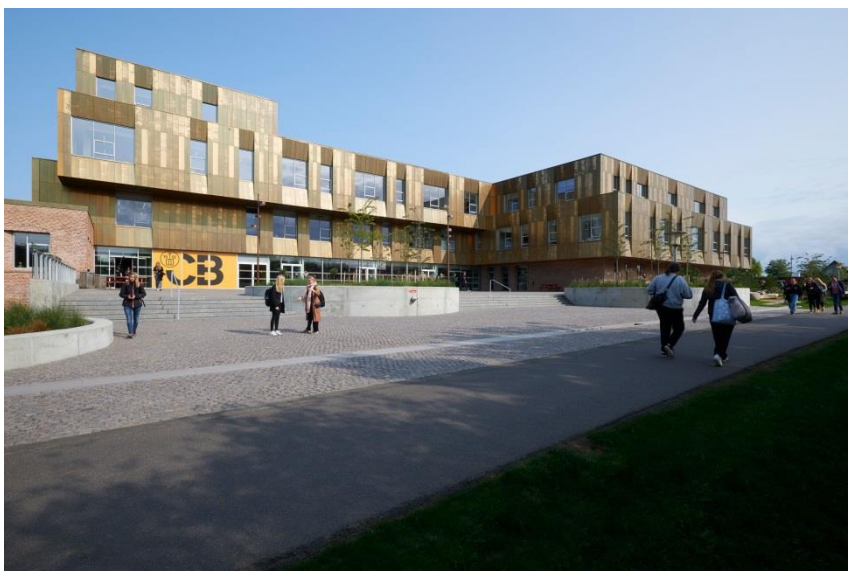
På billedet ses Campus Bornholm, der udbyder gymnasiale og erhvervsfaglige uddannelser samt

Vi ønsker ikke at udkonkurrere eksisterende tilbud, men vil derimod samarbejde på tværs af institutioner – både lokale og omkringliggende. Vejen til målet er, så at sige, at sammensætte Campus Furesø ved, at veletablerede institutioner i Region Hovedstaden opretter filialer i en organisation, der til sammen udgør Campus Furesø.