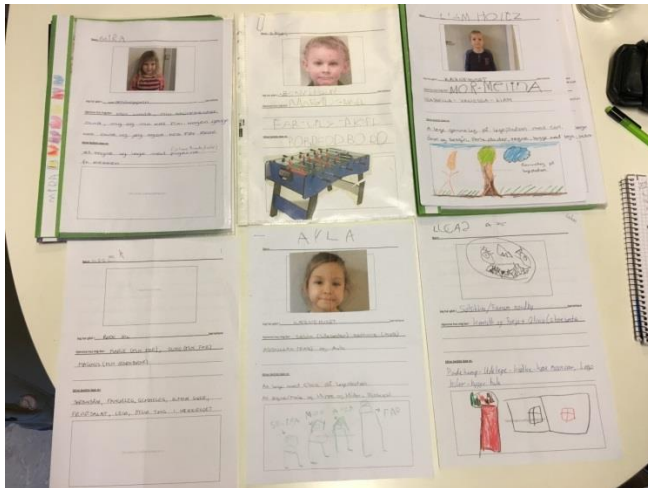
2. Foto - breve