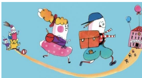
1Tegning - børn på vej til skole

Børnehaverne samarbejder fortrinsvis med de FFO'er og skoler, som de ligger fysisk tæt på og som flest børn skal gå i. I Farum ligger dagtilbud mere spredt end skoledistrikterne. For at gøre samarbejdet mellem børnehave og FFO-skole mere overskueligt, er der lavet en fordeling, efter erfaring for hvilke skoler børn går til, det er i disse samarbejdsgrupper at det tætte overgangssamarbejde foregår.