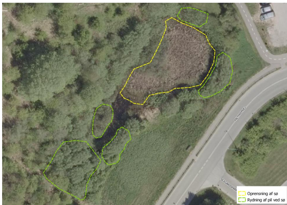
Figur 1. Områder med oprensning og rydning. Søen oprenses inden for den gule markering, og pilekrat ryddes inden for den grønne markering.

bredbladet dunhammer. Der vokser derudover blandt andet vandpeberrod og sump-forglemmevej i vandet, og bredvegetationen består blandt andet af nikkende star, bittersød natskygge, lyse-siv, sværtevæld og blære-star. Hele bredden af søen er tilgroet i pilekrat.