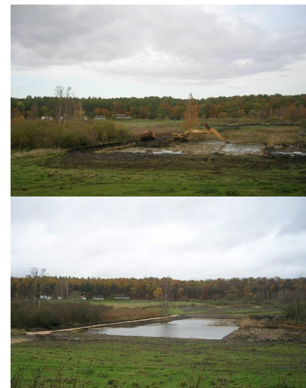
Reetablering af tørvegrav i 2008.

Fra stierne i Oremosen kan man gå langs Snarevadsgrøften til Ganløse Ore, et stort skovområde.