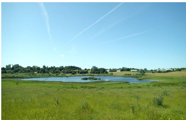
Udsigt over Præstesø.

I 1990'erne har Københavns Amt genskabt en del af den tidligere sø og de åbne enge. I dag er søen hjemsted for ynglende gæs og viber, ligesom der på engene ved søen og bredderne er en artsrig vegetation af bl.a. langbladet ranunkel, kærfnokurt, og elfenbens-padderok.