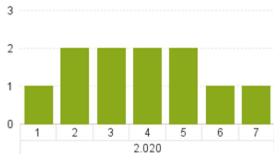
Antal Furesø borgere som står på venteliste til bolig i anden Kommune (ultimo måned)

Ældre og handicap egnet bolig til anden Kommune